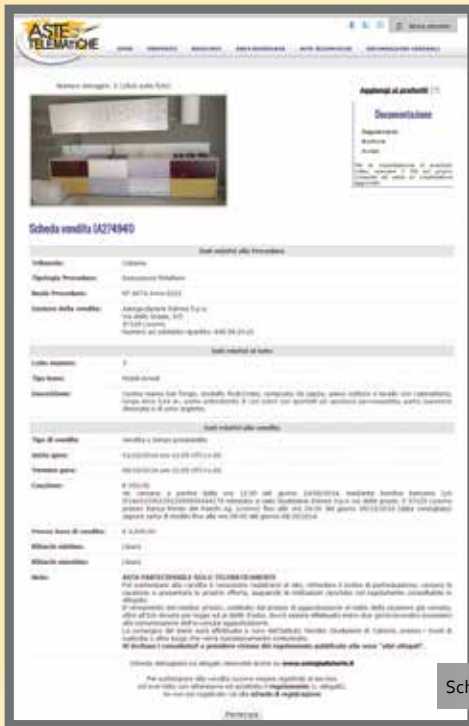
Scheda vendita di un bene

Aste Telematiche provvede per ogni bene alla redazione dell'avviso di vendita e del regolamento tecnico per la partecipazione. Tali documenti sono visibili in area pubblica ad accesso libero in qualità di atti ufficiali della vendita, unitamente alla perizia, alle fotografie e all'eventuale filmato o tour virtuale.