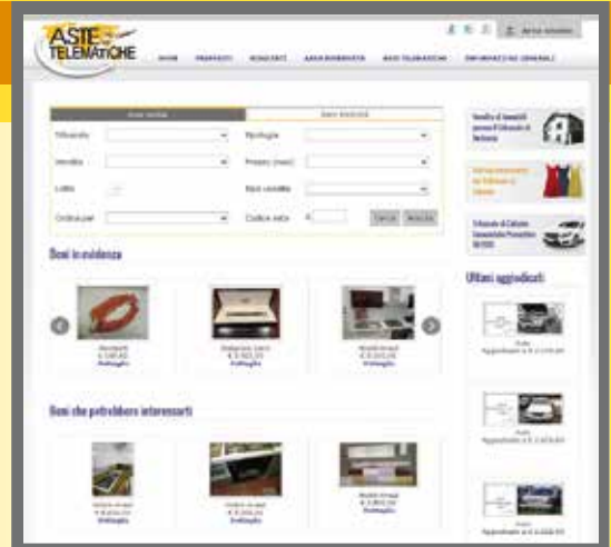
Home page di astetelematiche.it