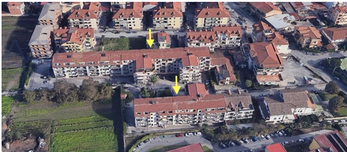
Foto n.1 - PANORAMICA IMMOBILE

Esso è costituito, dal punto di inquadramento generale, da due distinti corpi di fabbrica asserviti da sei scale condominiali con relative cabine ascensore.