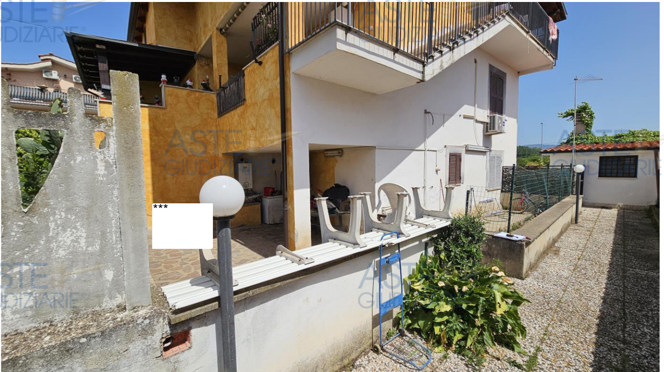
Corte esterna con veranda