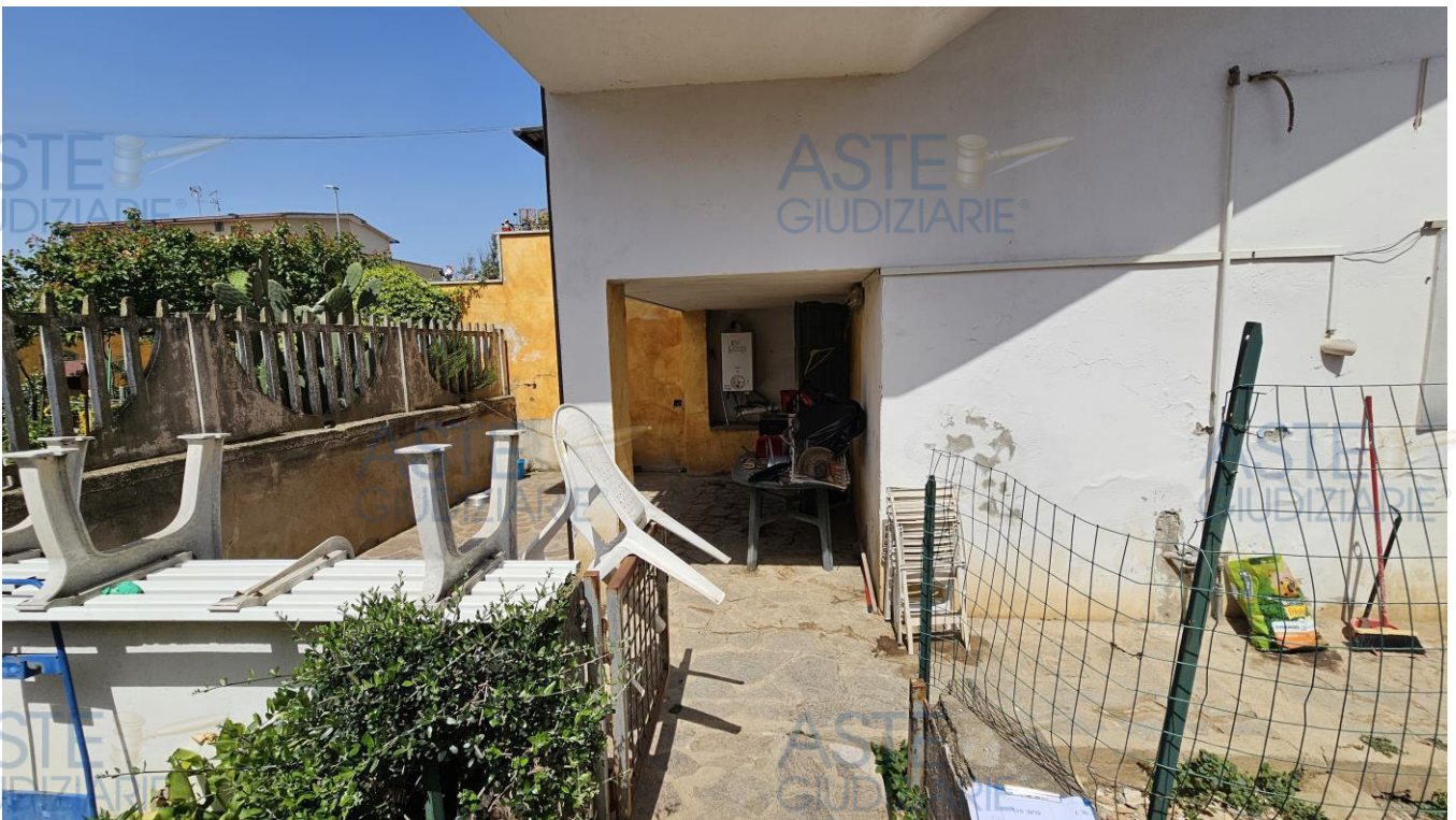
Corte esterna con veranda