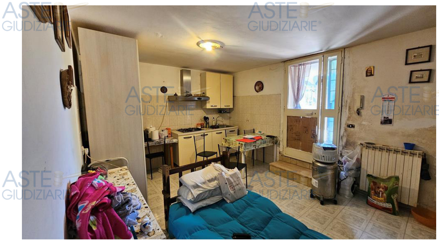
Soggiorno pranzo angolo k