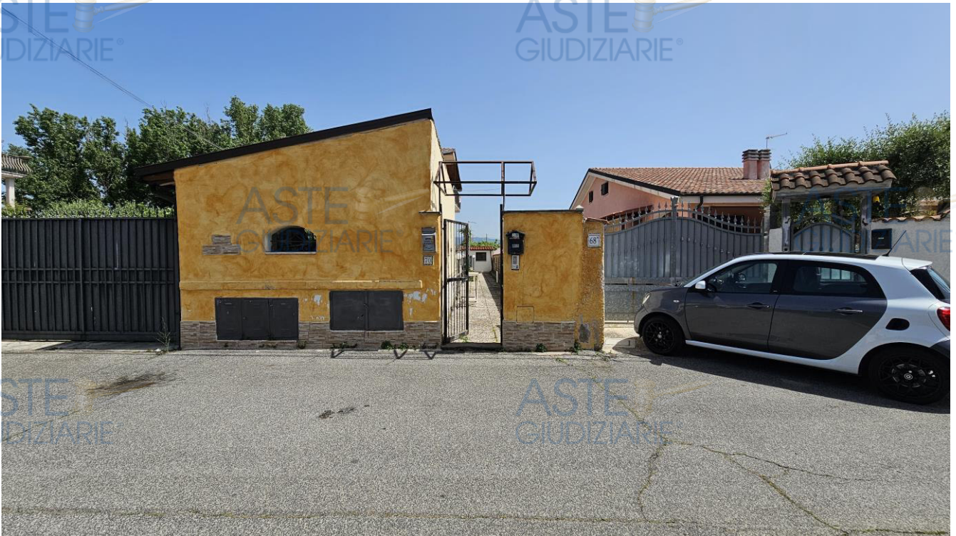
Accesso da Via Agugliano – si accede all'appartamento tramite stradello condominiale