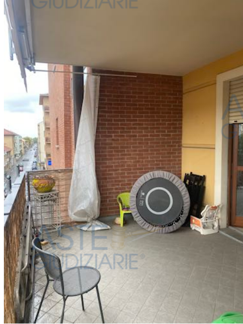
Balcone su Via Minghetti