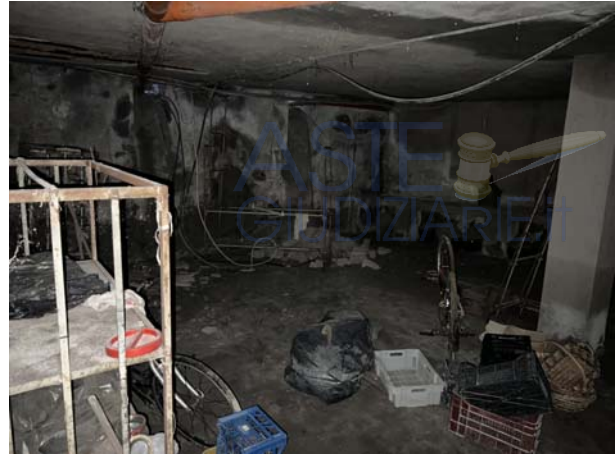
Vista del locale cantinola al livello seminterrato (sub 6)

L'appartamento al piano primo (sub 4), occupata dagli stessi esecutati, versa in discrete condizioni. Esso è composto da ampia zona giorno con angolo cottura, disimpegno, tre camere e due bagni oltre una balconata a sviluppo lineare che insiste sul fronte principale e sulla quale è parzialmente presente una veranda che ospita una piccola lavanderia.