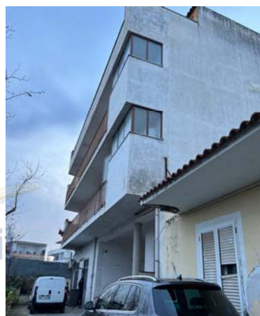
Vista dell'area di accesso al fabbricato

L'unità terranea (sub 2), che trae accesso diretto dalla summenzionata stradina, allo stato risulta priva di occupazione; essa è composta da soggiorno con angolo cottura, camera, disimpegno e bagno. La detta consistenza, come accennato, è stata di recente ampliata con l'annessione del limitrofo locale (sub 3), un tempo adibito ad autorimessa, che ha subito, all'uopo, una riduzione di dimensione.