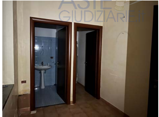
Particolari interni dell'unità terranea censita con il sub 2