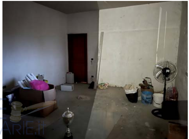
Vista del collegamento realizzato tra l'unità sub 2 e il locale sub 3 nonché particolare di quest'ultimo

L'accesso alle altre unità del fabbricato avviene dalla scala interna allo stesso. Da questa, infatti, si raggiunge tanto il livello seminterrato, ove è allocato un corridoio e un ambiente al rustico ed insalubre (sub 6) utilizzato come cantinola, tanto si sale alle soprastanti unità (sub 4 al piano primo e sub 5 al piano secondo) e all'ultimo livello (piano terzo).