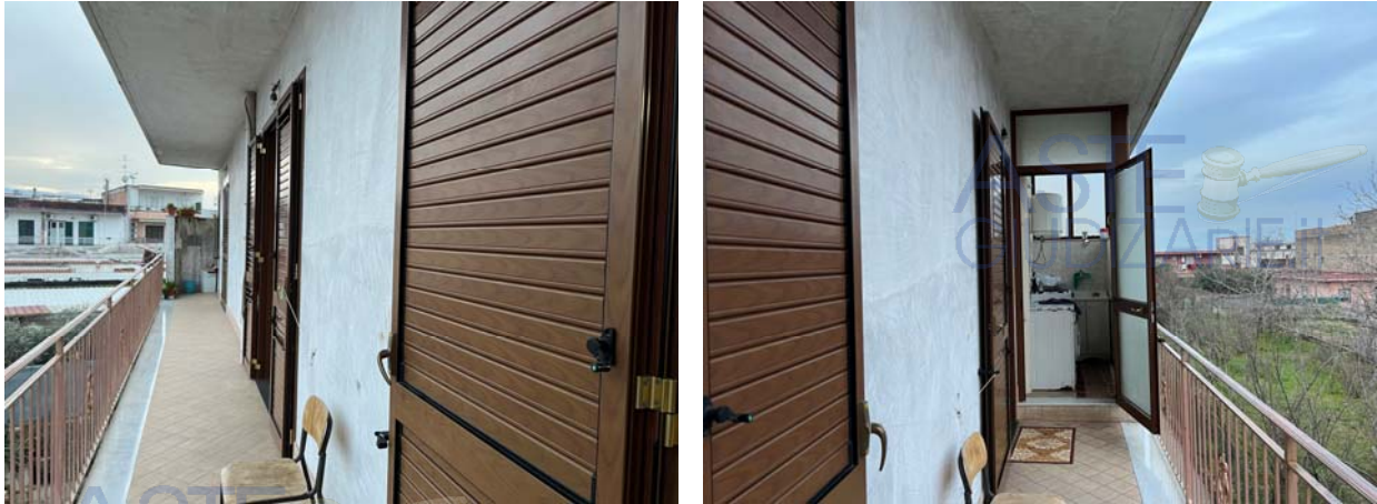
Particolari del balcone annesso (sub 4)

L'unità al piano secondo (sub 5) risulta al rustico ossia non ultimata; in particolare, priva di partizioni, finiture ed elementi impiantistici. Non sono presenti neanche gli infissi, se non la porta di caposcala. Anche detta unità presenta un balcone, parzialmente verandato, posto a margine del prospetto principale.