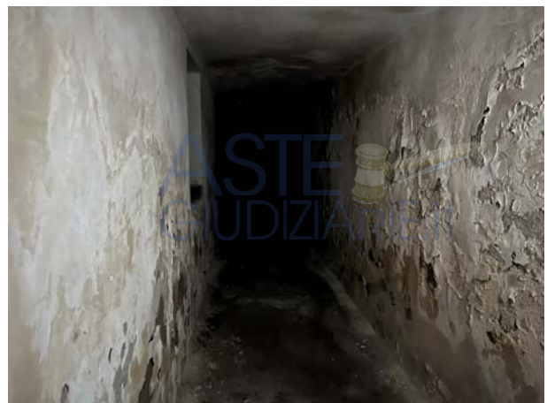
Vista della porta di accesso ai rampanti che conducono al livello seminterrato e del cunicolo che disimpegna l'ambiente utilizzato come cantinola