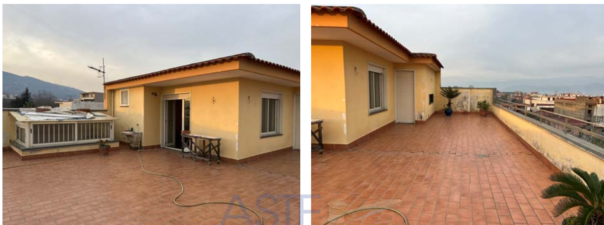
Vista esterna dell'unità al livello copertura (piano terzo) priva di identificativo catastale