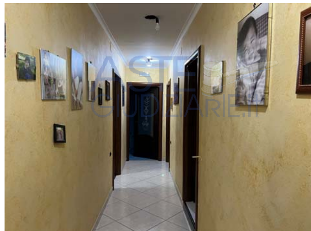
Particolari interni (sub 4)