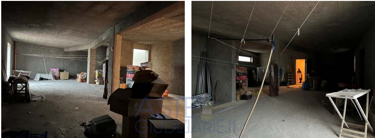
Particolari interni (sub 5)

L'unità al piano secondo (sub 5) risulta al rustico ossia non ultimata; in particolare, priva di partizioni, finiture ed elementi impiantistici. Non sono presenti neanche gli infissi, se non la porta di caposcala. Anche detta unità presenta un balcone, parzialmente verandato, posto a margine del prospetto principale.