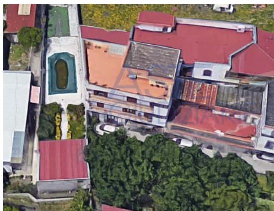
Viste aeree del fabbricato di vico del Canto n. 27/3, San Giuseppe Vesuviano (Na)

L'accesso principale al fabbricato avviene dal civico n. 27/3 in corrispondenza del quale si apre il portoncino che immette nella scala interna che collega tutti i livelli dello stesso, ad eccezione dell'unità abitativa terranea (sub 2) che presenta accesso autonomo e diretto dalla strada. Aveva accesso diretto e autonomo dalla strada anche il locale censito come box auto (ossia il sub 3) prima che venisse ridotto (in particolare, accorciato) e annesso alla limitrofa unità (sub 2); tale attività ha, infatti, comportato l'eliminazione della originaria porta di accesso, trasformata in una finestra prospettante sul portico anteriore.