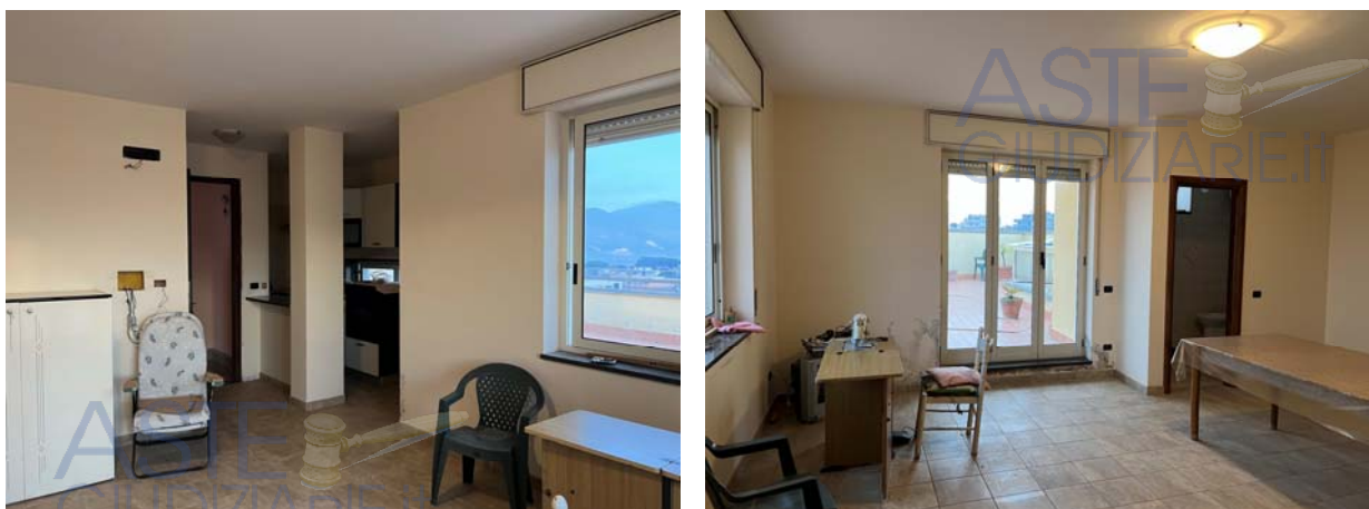
Vista interna dell'unità al livello copertura (piano terzo) priva di identificativo catastale

fabbricato nel proprio lato posteriore al fine di creare ulteriori punti di luce ed areazione alle varie unità.