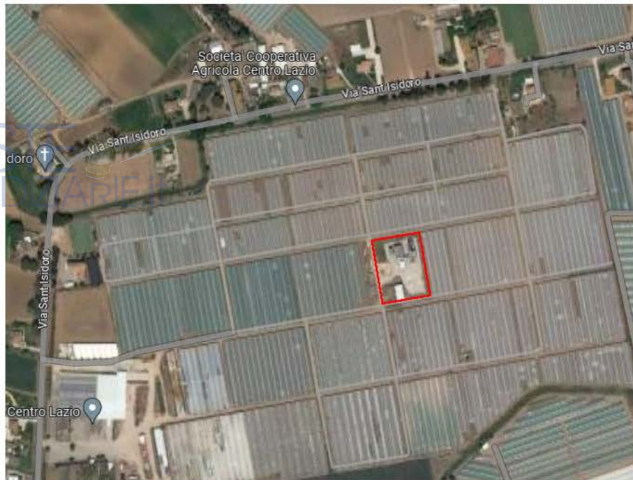
Figura 2: ubicazione geografica del sito