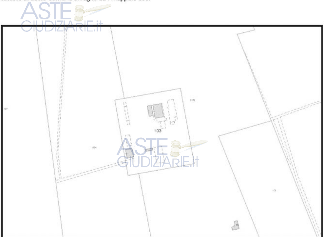
Figura 1: ubicazione catastale del sito

L'impianto oggetto della presente analisi è ubicato nel comune di Sabaudia, Provincia di Latina ed è censito al catasto di detto Comune al foglio 114 mappale 103.