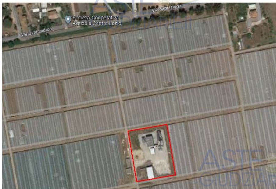
Figura 3: centrale a biomassa