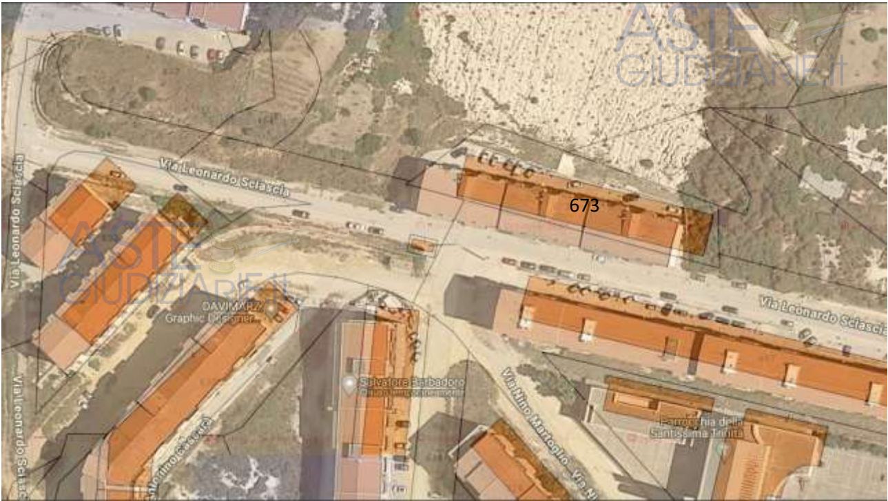
Figura 2 – Sovrapposizione di catastale su ortofoto.