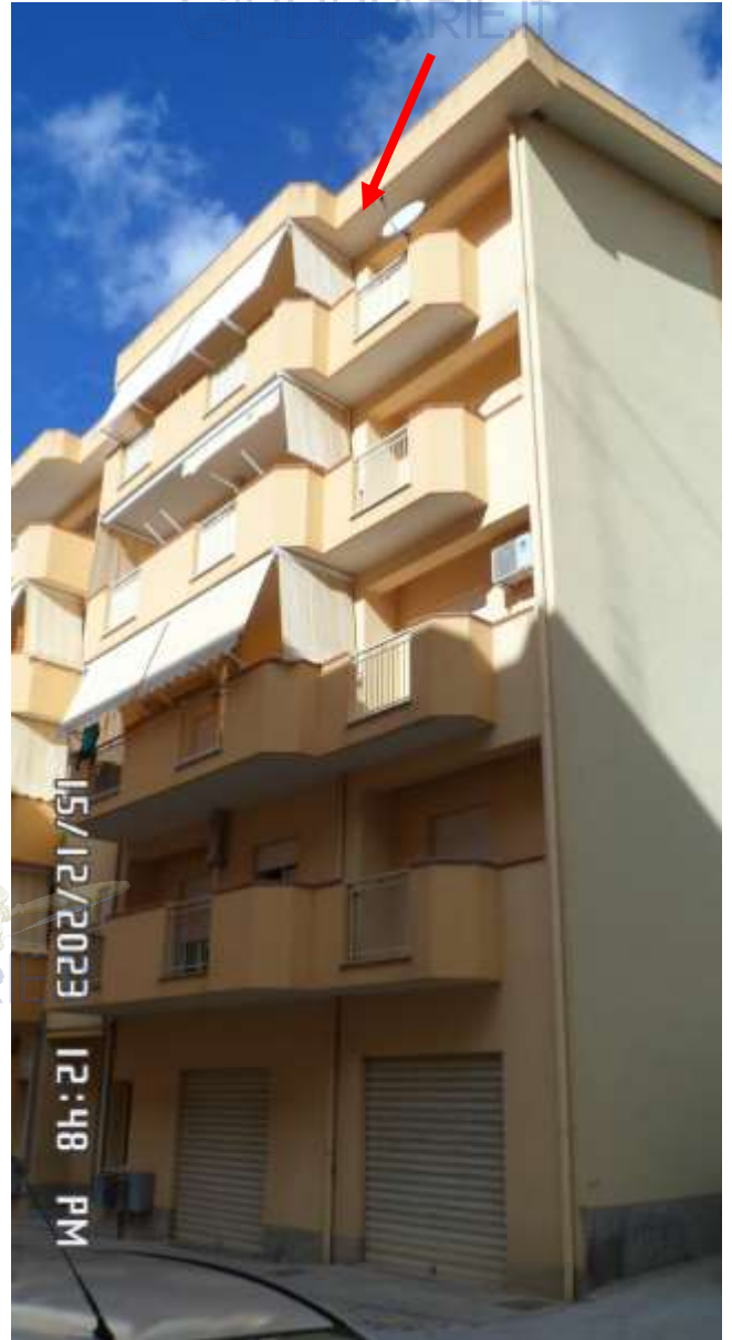
Foto 4 - Veduta dell'appartamento dal Viale Leonardo Sciascia