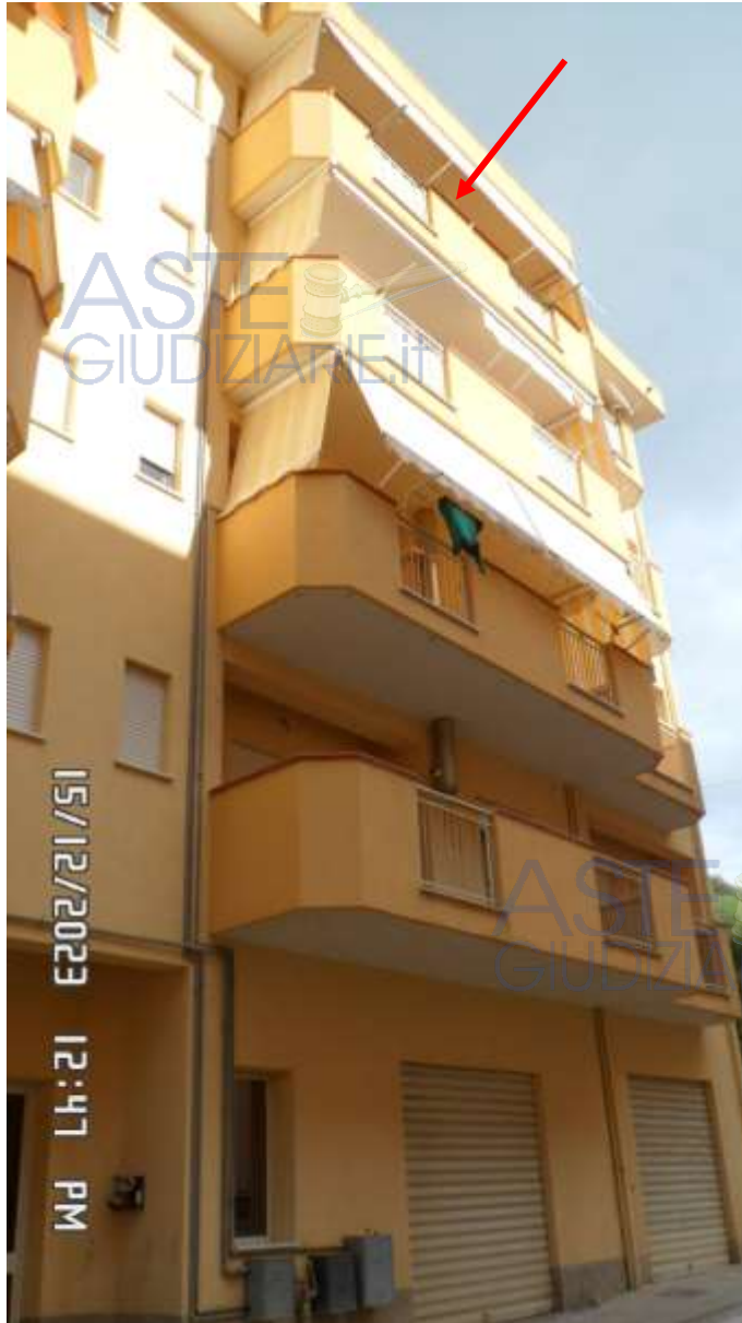
Foto 3 - Veduta dal viale Leonardo Sciascia dell'appartamento a quarto piano