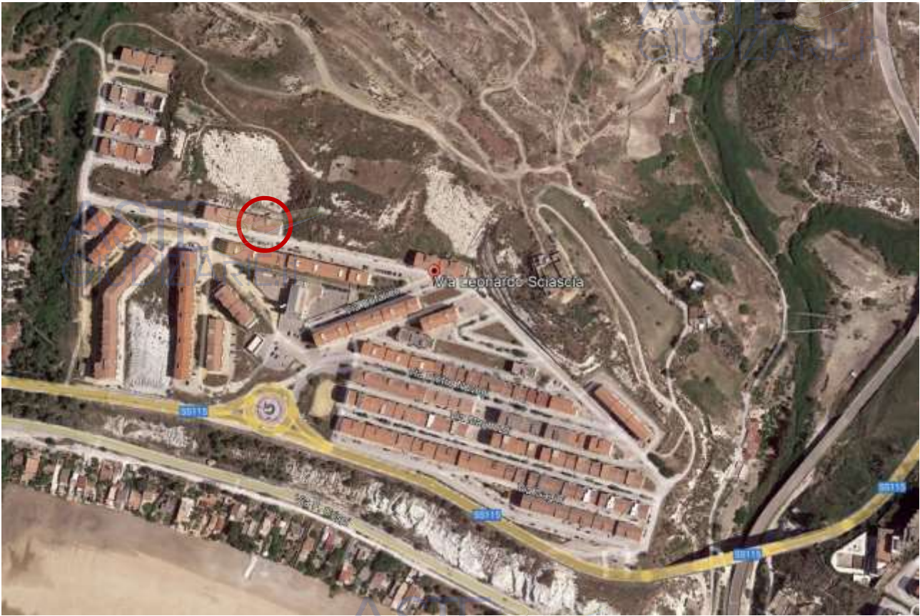
Figura 1 – Foto satellitare.

Al Catasto Edilizio del comune di PORTO EMPEDOCLE (AG):