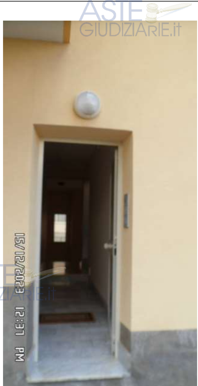
Foto 6 – Veduta del portone della scala del palazzo sul retro nello spazio condominiale