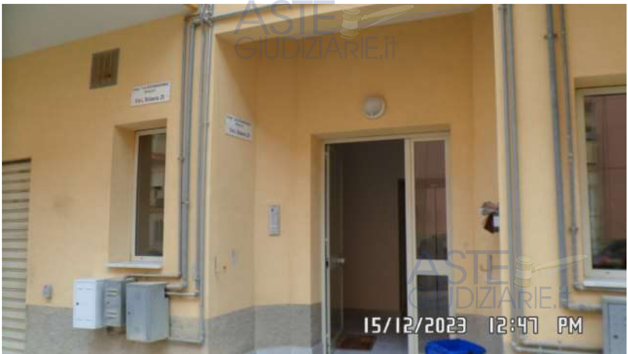
Foto 2 – Veduta del portone d'ingresso sul viale Leonardo Sciascia n. 25